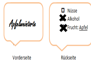
Kuchenschild bitte ausfüllen/ankreuzen und in die Klarsichtfolie legen