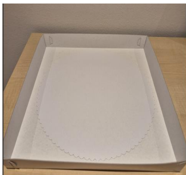
Schachteldeckel als Unterlage mit Tortenunterlage