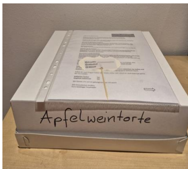
Beschriftete Schachtel als „Tortenhaube“